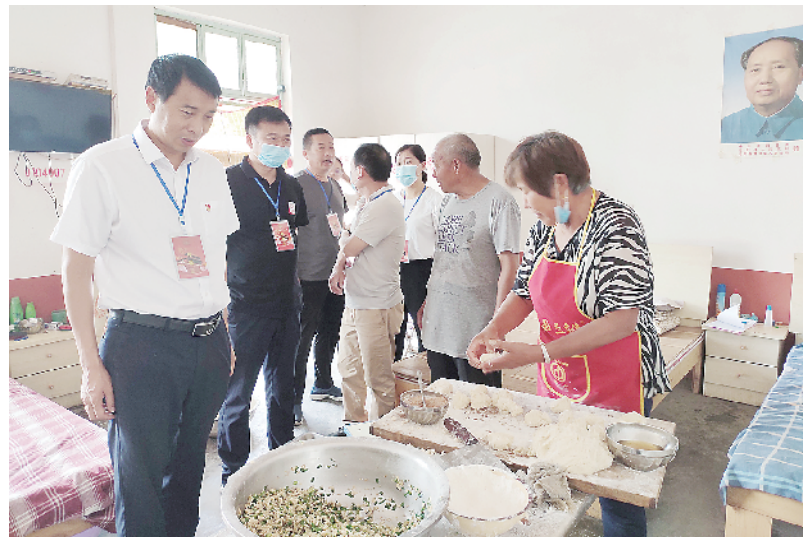
驻白楼镇市人大代表到福利院视察

以人为本,厚植民生福祉。坚持为民履职,畅通举报投诉渠道,依法及时受理群众案件,把矛盾化解在基层,维护社会稳定。加大救助力度,帮助困难群体排忧解难,使惠民政策落实到每一户困难家庭、每一位困难群众。