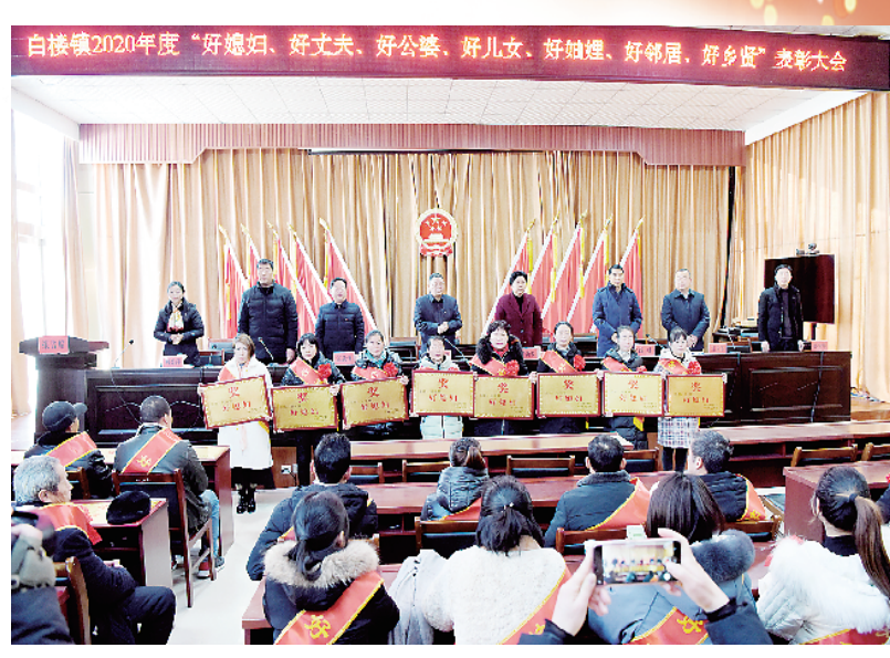
白楼镇隆重表彰“好媳妇、好婆婆、好乡贤”

五年来,在区委、区政府的正确领导下,在社会各界的关心支持下,淮阳区白楼镇团结带领全镇党员、干部,牢牢把握稳中求进工作总基调,贯彻新发展理念,落实高质量发展要求,凝心聚力,攻坚克难,统筹做好党建、稳增长、惠民生、防风险、保稳定等工作,党组织的创造力、凝聚力和战斗力不断增强,取得了明显的成效,先后获得86个国家及省市级荣誉称号,其中国家级荣誉称号2个,省级荣誉称号15个,市级荣誉称号33个。