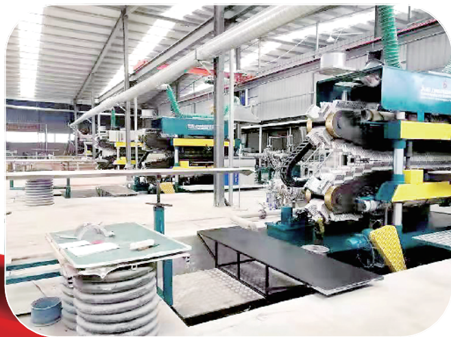
招商引资项目通源管业生产车间