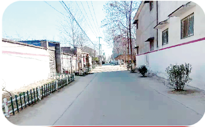
干净整洁的乡村人居环境