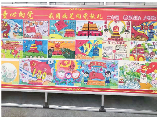
实验小学的庆祝建党一百画展

该校采用多种方式开展党史学习教育活动。借助每周一升国旗仪式，向全校师生宣讲以《党在我心中，成就中国