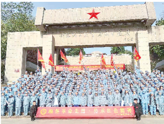
三中的红色研学活动