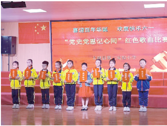
第二实验小学革命歌曲比赛

一系列学党史活动，实验小学、第二实验小学、和建南小学等都分别开展了丰富多彩的学党史活动。