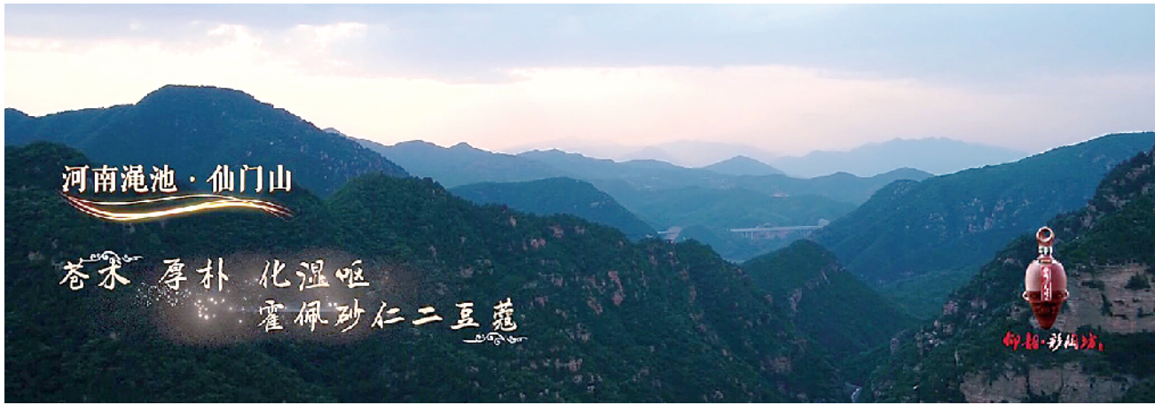
《端午奇妙游》节目取景地——仰韶酒庄仙门山

水下中国风舞蹈《祈》，舞者化身“洛神”绝美登场，高度还原了《洛神赋》中对洛水河神的描画，这部绝美的舞蹈作品，迅速在社交媒体上引发热议，更让中国传统文化在翩翩舞步中得以传承、延续。在此之前，一首《龙舟祭》再现端午前夕祭祀盛景，而人们祭拜洛水河神，祈福端午安康的场景中，领祭者用以敬奉天地的小口尖底瓶，更是吸引了众多网友的眼球。它是收藏在中国国家博物馆中的