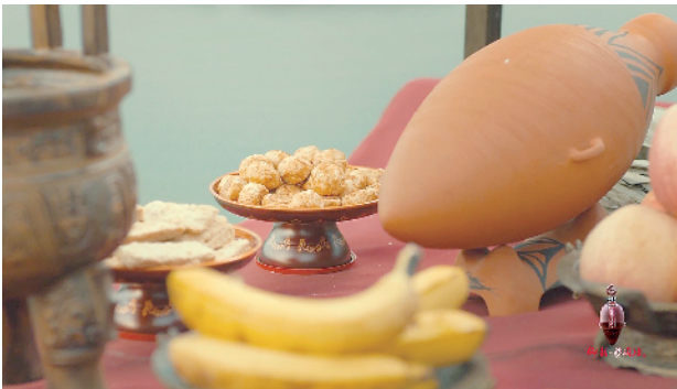
《端午奇妙游》节目剧照