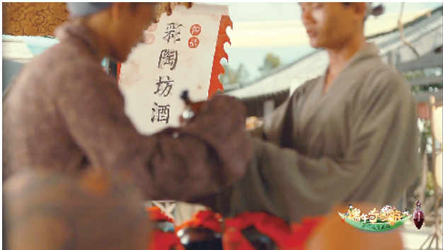
《端午奇妙游》节目剧照