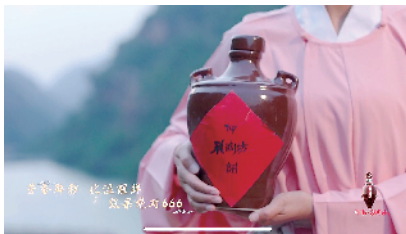
《端午奇妙游》节目剧照

白酒文化作为中国传统文化中的重要一极，在文化传播上扮演着重要角色，仰韶彩陶坊则以醇香细腻的口感、质朴厚重的格调打造出中国白酒文化的经典 IP，深耕文化建设，为品牌“活力”再添新意，在中原大地收获良好口碑的同时，构建起白酒文化与传统文化相融合的更时尚、更潮流的全新表达。接下来，仰韶彩陶坊将继续现身河南广播电视台打造的中国节日系列第五集——“中秋奇妙游”，进一步创新品牌传播方式，推动品牌形象升级。今后，加速仰韶文化与新时代表文明的深度融合也将成为仰韶酒业“十四五”阶段对文化品质提升的内在要求。