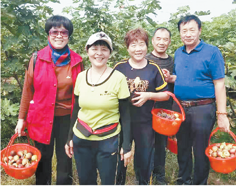
市民体验采摘之乐。

年接待游客达2万人次，这里还被河南省文化和旅游厅授予“河南省旅游扶贫示范户”，被周口市农业局授予“2018年度市级示范单位”，被西华县乡村旅游经营单位登记评定委员会授予“体验型一星级乡村旅游经营单位”。