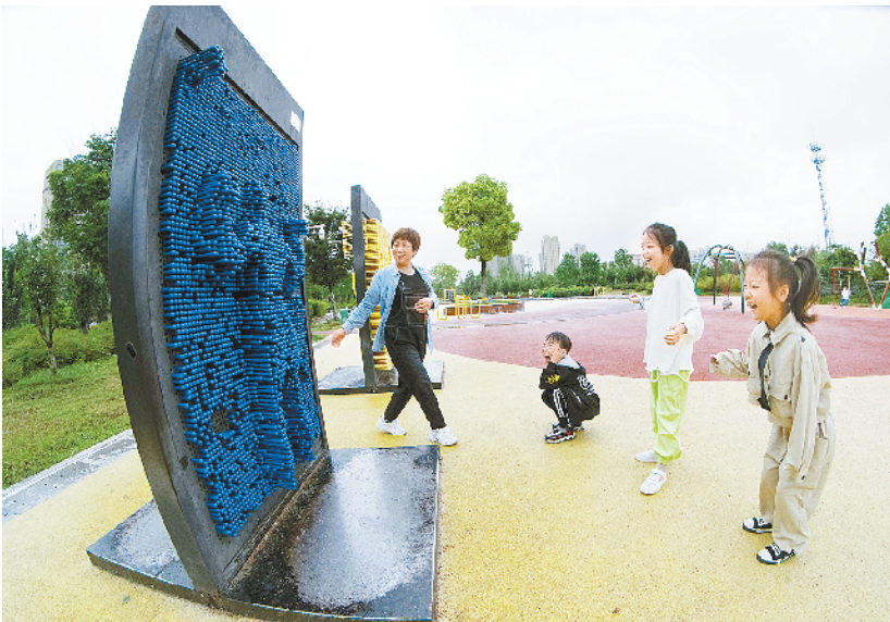
今年的暑假撞上“汛情”“疫情”，让孩子们假期时光困在家里度过。疫情缓解后，困在家的孩子拽着假期的“尾巴”到公园里尽情玩耍。