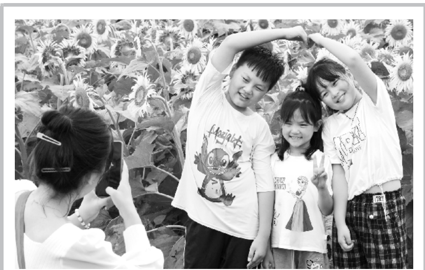
向日葵怒放 秋天里赏景 时近中秋,商水县邓城镇沙河畔,数百亩向日葵怒放,大地如披锦绣,一片流金似海,吸引远近众多游客前来观赏游玩。

增强紧迫感和责任感。全市各级各有关部门要坚决遏制道路交通事故的发生,为全市经济社会高质量发展营造良好的交通运输环境。二要聚焦重点,从严从实从细开展专项整治行动。要全面排查安全隐患,坚决彻底整治,严格规范执法,强化以案促改。三要加强领导,压实责任,确保专项整治行动取得实效。各级各有关部门要发扬钉钉子的精神,积小平安为大平安,为做好各项工作、完成年度目标任务创造好的交通环境。 会议传达了《周口市道路交通安全隐患大排查大整治行动方案》。会议还对清理高速公路沿线广告设施工作进行了部署。②18