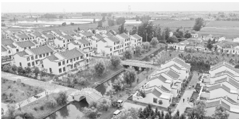
以烈士名字命名的佳富村华丽蝶变。