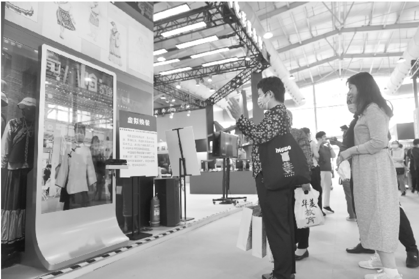
服贸会上的“衣食住行”

拉萨市达孜区克日村的农民在收获青稞(9月6日摄)。 当前正值青稞收获季节,拉萨河谷一带农民抓紧收割,农田里一片丰收的繁忙景象。