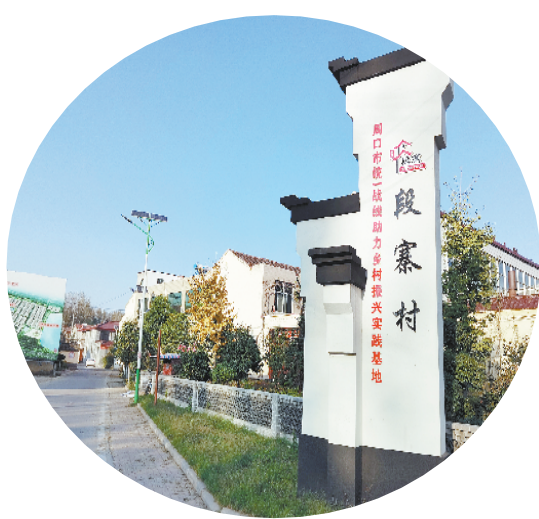
举全市统一战线之力打造乡村振兴行动实践基地——段寨村。