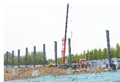
河南双诚食品有限公司熟食生产建设项目