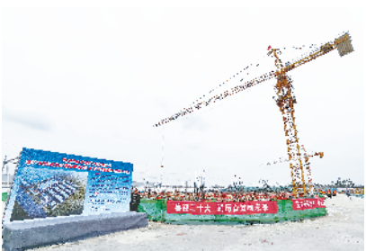
周口市凯诚精密工业有限公司年产3000万套精密线缆连接组件及视觉模组建设项目