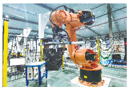
扶沟县嘉友机械制造有限公司建设项目