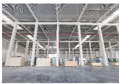
浩邦年产48000吨针织印染生产线项目

当天,观摩组深入商水县、项城市、沈丘县、郸城县、鹿邑县、扶沟县,对18个县域主导产业项目进行观摩。从观摩情况看,各县(市)围绕主导产业、优势产业,坚持创新驱动,强化科技支撑,整合资源优势,着力建链、补链、延链、强链,实体经济根基进一步筑牢,重点产业集群不断做大做强,经济高质量发展驶入了创新赋能的快车道。