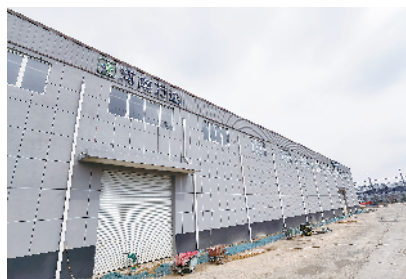
河南万达工业智能工程设备加工项目

该项目总投资15亿元,规划建设以铸造业为主的标准化厂房、研发中心、智能加工中心等,安装80条智能化生产线。目前,项目正在建设中。项目全部建成后,可年产特种合金材料20万套、铝制缸体缸盖、发动机体、变速箱缸体100万只,实现年产值30亿元,安排就业人员1200人以上,填补扶沟县没有铝制缸体缸盖的空白。②2