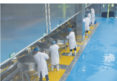
扶沟县中央厨房建设项目