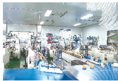
金丝猴食品烘焙生产线智能化改造项目