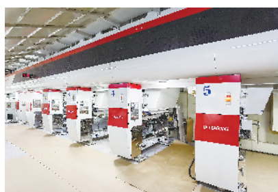
河南润恺有限公司年产4亿米装饰木纹纸建设项目