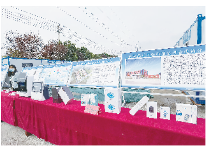
乐普大健康产业园无菌生物制剂、医美产品及医疗器械生产项目