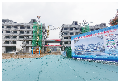
河南国网自控科技股份有限公司智能配电开关系统项目