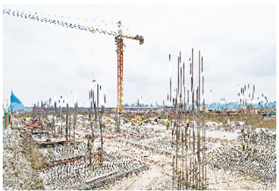
郸城县正星粉业有限公司年加工40万吨小麦面粉、6万吨谷朊粉项目