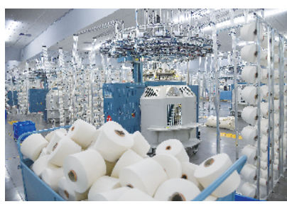
盛泰针织造生产线项目