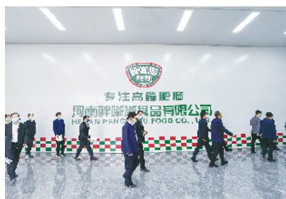
河南胖嘟嘟食品有限公司年产3万吨猪肉制品精深加工项目