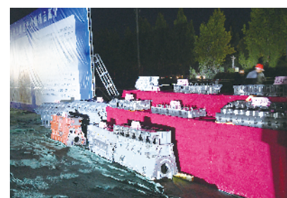
扶沟县绿色铸造产业园项目