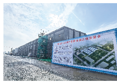
奥园美乐农副产品精深加工项目