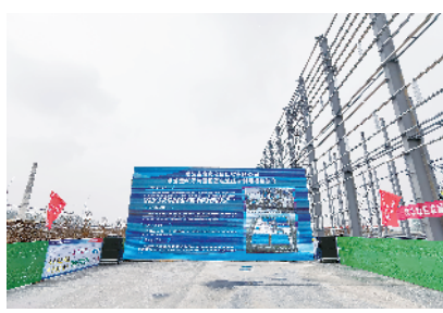
项城市豪鑫金属回收有限公司年处理18万吨废旧蓄电池综合利用及全密封免维护动力铅蓄电池生产项目