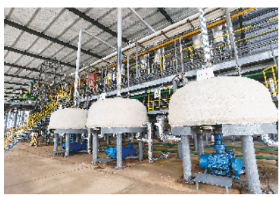
周口红旗生物科技有限公司年产4000吨医药中间体项目