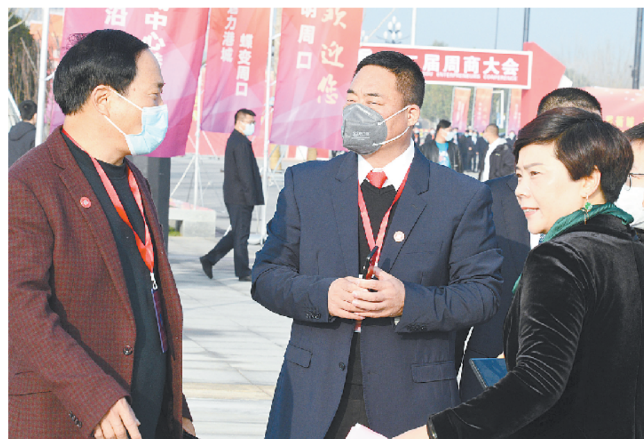
代表在会场开心地交流