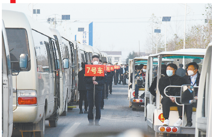
周商代表在西华机场参观