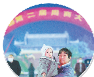
群众关注周商大会