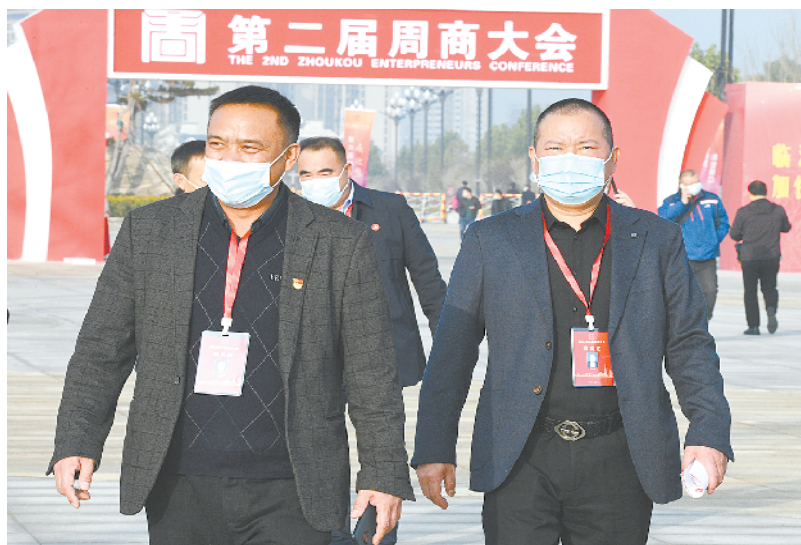
周商代表步入会场