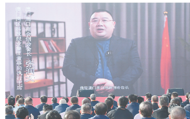
澳门周商代表连线大会发言