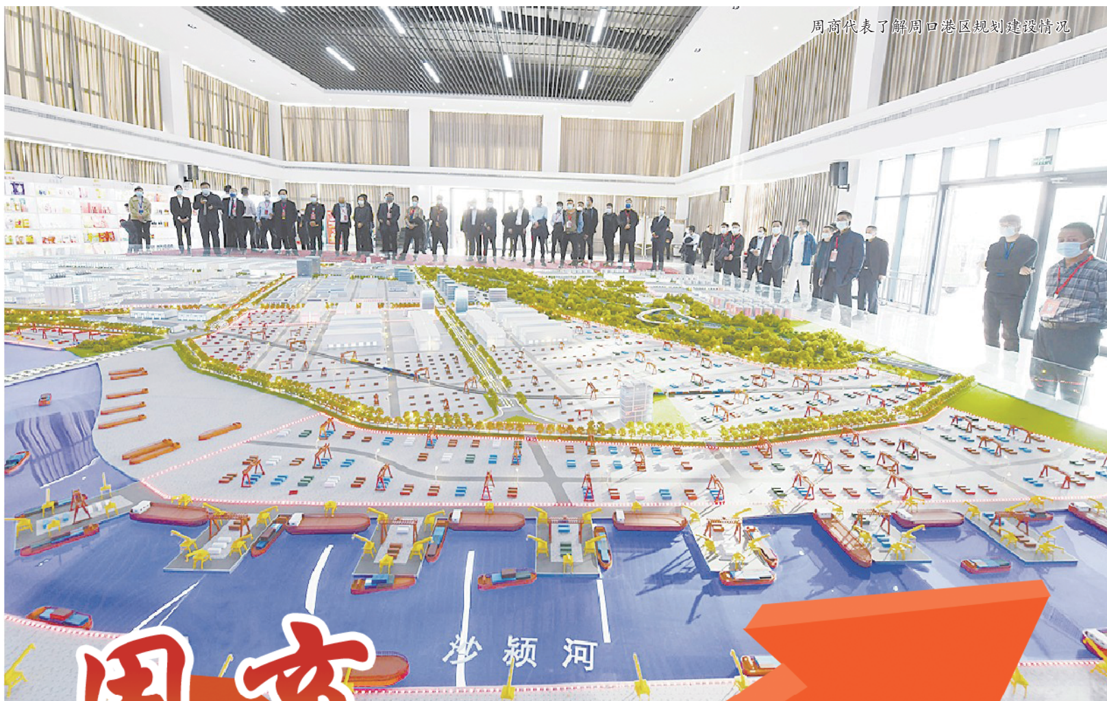
周商代表了解周口港区规划建设情况