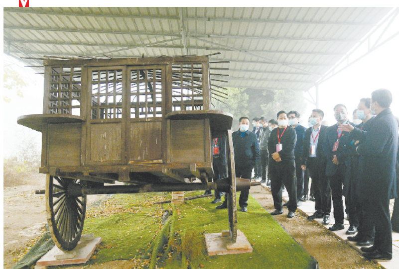
周商代表在平粮台遗址参观