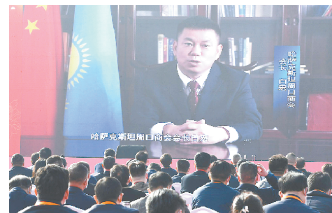
海外周商代表连线大会发言