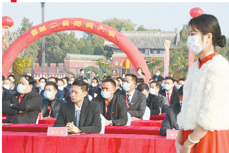
周商代表齐聚会场