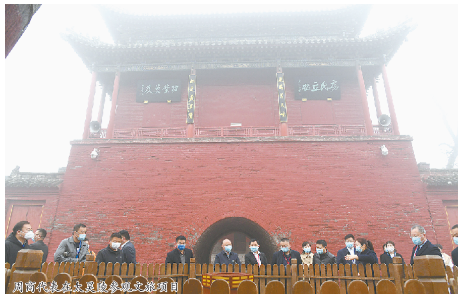
周商代表在伏羲陵参观文旅项目