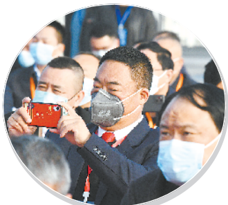
参会代表用手机记录难忘瞬间