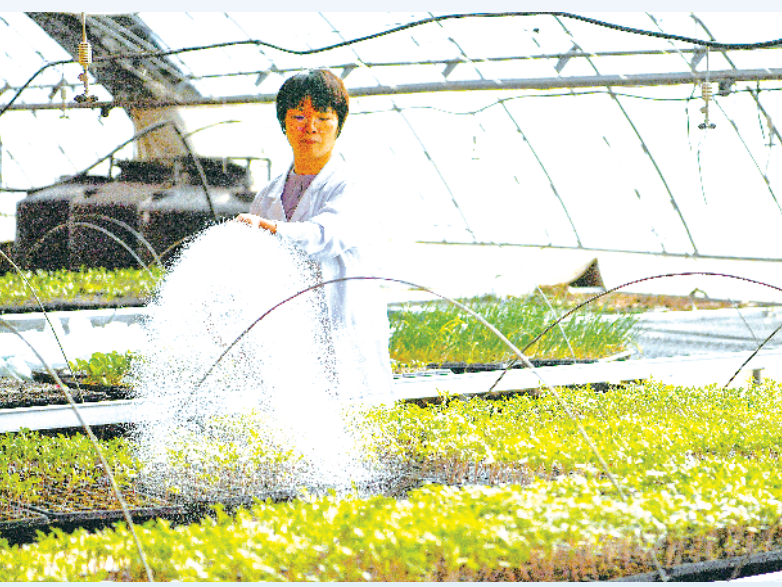
科研育种助力春耕备耕