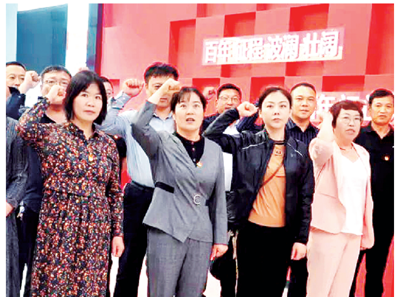
11月1日,太康市人大常委会机关全体委员,到太康县水东革命纪念馆开展廉政警示教育。