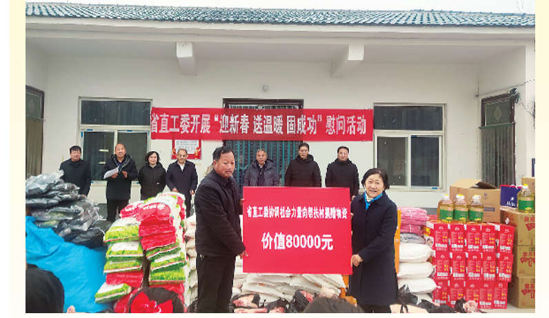
1月31日,省委直属机关工委到定点帮扶村——扶沟县练寺镇刘村开展“迎新春 送温暖 固成果”慰问活动,为刘村困难群众捐赠价值9万元的物品,并协调省残疾人福利基金会、省红十字会、省慈善联合总会等为刘村捐赠价值8万元物资。图为捐赠现场。