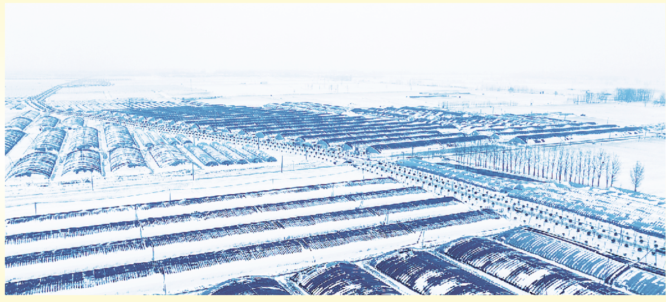
2月3日,在河南省扶沟县蔬菜园区,千亩蔬菜大棚被白雪覆盖。为降低大雪对棚菜生产带来的不利影响,当地菜农在雪停间隙抓紧开展除雪作业。据了解,扶沟县是河南省蔬菜种植第一大县,年播种面积达52万亩,年均产量270万吨,产值达46.8亿元。

胸痛中心、卒中中心、创伤中心建设,完善院前急救功能;建立多学科诊疗模式,完善院前急救和院内急救网络,着力构建快速、高效、全覆盖的急危重症医疗救治体系,增强了医疗救治能力,全面提升了医院管理水平和技术水平。