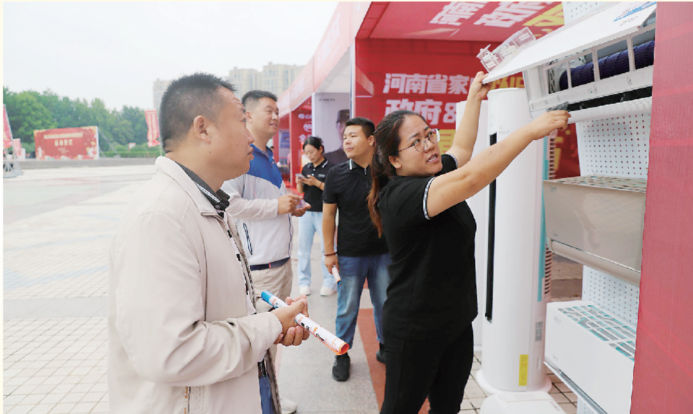
9月15日,周口市消费品以旧换新集中展销活动启动仪式在开发区人民广场举行。本次展销活动时间从9月15日持续到10月31日,共47天,产品涵盖家电、数码、汽车等领域。