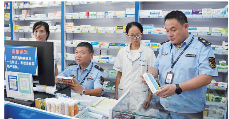
工作人员对药店的药品经营管理销售情况进行现场检查。

本报讯(记者 宋风 通讯员 王燕文/图)今年是《中华人民共和国药品管理法》颁布40周年,为向群众普及安全用药、用械、用妆知识,近日,周口市市场监督管理局港区分局围绕“药品安全 良法护航”主题开展2024年“药品安全宣传周”活动。辖区药店、医院、诊所、沿街门店负责人参加活动。