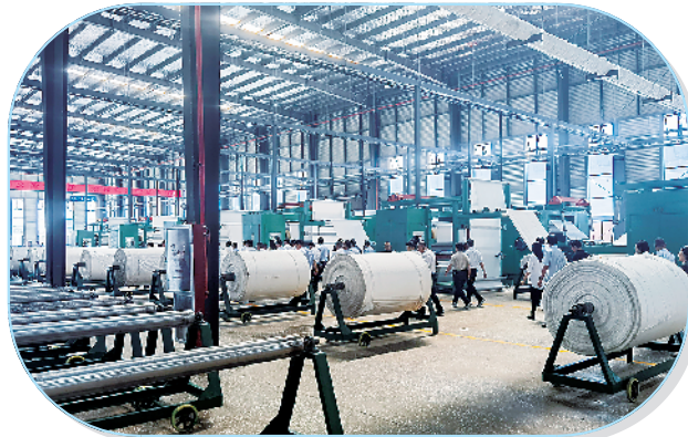
华和年产50000万米胆布项目。