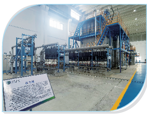
河南省龙源纸业股份有限公司年产200万吨绿色环保包装新材料项目。