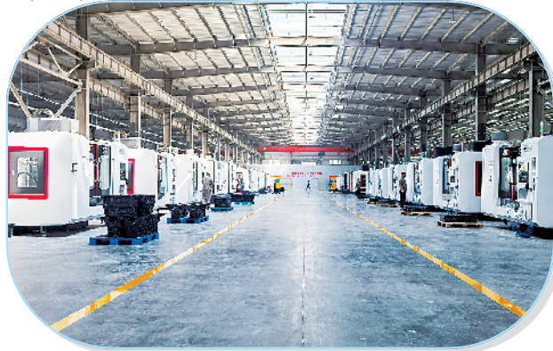
扶沟县冠宇汽车零部件生产加工项目。

该项目总投资1.2亿元,总建筑面积4.5万平方米,主要建设仓库、车间、办公楼、研发中心等,规划安装1条染色生产线和4条定型机生产线。目前,该项目2栋厂房主体建设完毕。项目满产达产后,可实现年产值3亿元、利税1500万元,安排就业人员100人以上。