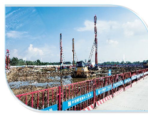
周口临港开发区仓储项目(一期)。

丝绒双轴喷气织布机200台,整修翻新相关生产车间。目前,项目已完成并投产。项目全部达产后,年产值约2.7亿元,每年可实现税收约2000万元,安排就业人员200人。