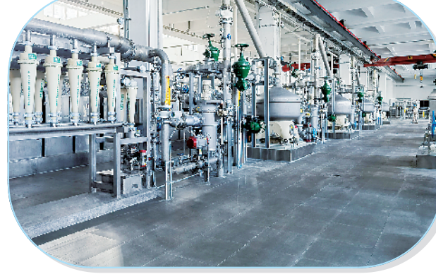
益海嘉里(周口)生物科技有限公司200万吨玉米精深加工项目(一期)。