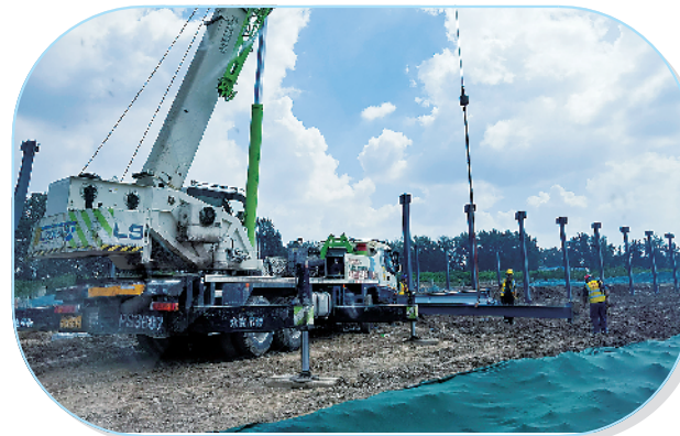
河南明正清真绿色肉食品有限公司牛羊肉全产业链园区项目。

该项目总投资3亿元,占地面积80亩,总建筑面积4万平方米,主要建设牛羊屠宰与分割车间、智能净化深加工车间、牛羊肉休闲食品车间、产品检测中心、冷库物流车间、研发楼及污水一体化处理系统等附属配套设施。目前,1号车间北半部分独立基础施工完成,2号车间独立基础施工完成。项目建成后,将实现年产值10亿元,可带动周边50家养殖场、500多家养殖户,提供600多个就业岗位,实现年税收3000多万元。