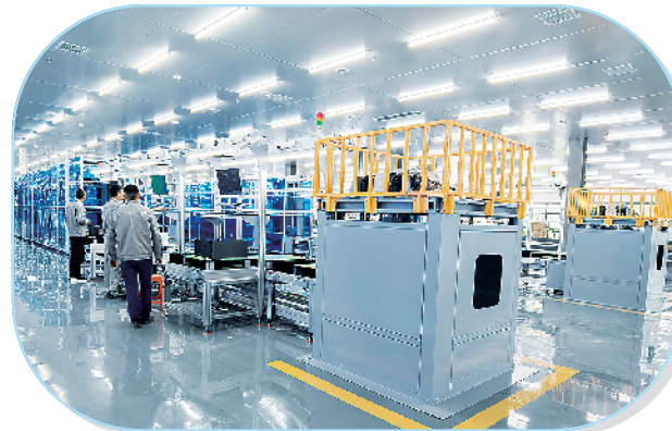
周口易通科技有限公司计算机生产线项目。

该项目总投资3亿元,占地面积28亩,总建筑面积约1.1万平方米,主要建设标准化生产车间及附属配套设施。目前,该项目已投产。项目满产达产后,年产值可达3亿元,年纳税2000万元左右,提供就业岗位200个。