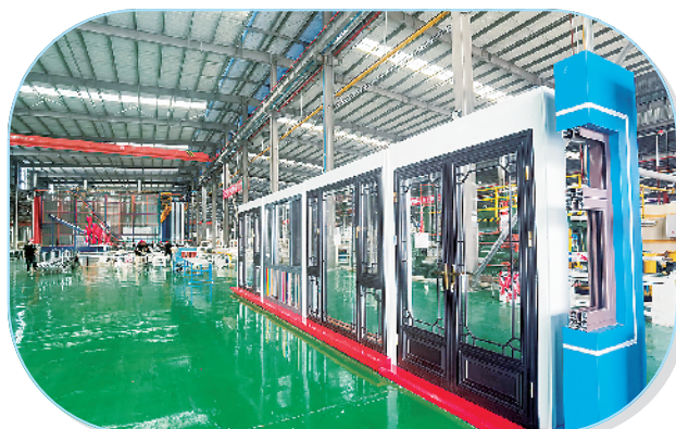
河南省华智造年产20万套智能精密结构件建设项目(一期)。