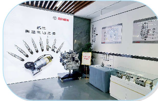
河南睿牛精密制造有限公司精密制造项目。