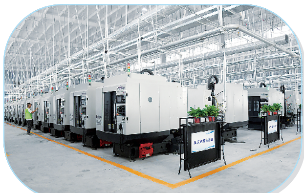
浙江利昇精密(耕亿达)年产6000万支智能终端零部件生产项目。

9月20日,全市2024年三季度“三个一批”重大项目建设观摩讲评活动继续进行。当天,观摩组深入西华县、扶沟县、太康县、淮阳区、周口临港开发区的主导产业项目进行实地观摩。从观摩情况看,各地立足本地资源,加快推动产业转型升级,着力打造上下游关联、横向耦合发展的优势产业集群,加快培育高质量发展的新动能、新优势。