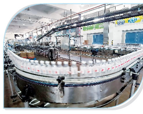
娃哈哈水汽生产线扩产能项目。