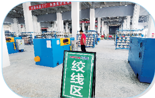
周口民赞科技新能源汽车充电设备建设项目。

该项目计划总投资20亿元,占地面积约600亩,总建筑面积约27.6万平方米,分两期进行。一期投资3亿元,占地面积约90亩,总建筑面积50100平方米,可年产20万套智能精密结构件。二期计划总投资17亿元,占地面积500亩,建筑面积约20万平方米,主要生产各种新型高端智能精密结构件。目前,项目一期已全部建成投产。项目全部建成后,可实现年产值3亿元、利税约3000万元,安排就业人员600人以上。