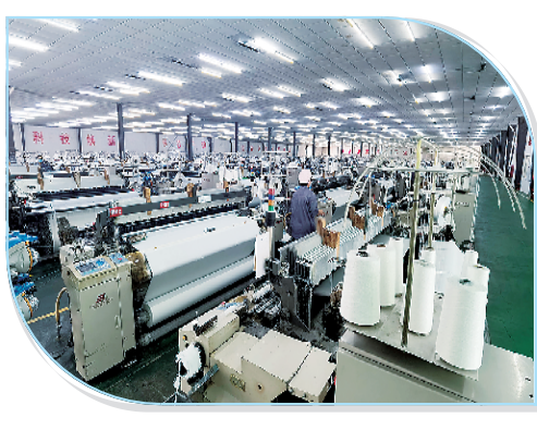
河南昌华纺织有限公司厂区基础改造、设备引进更新和改造项目。