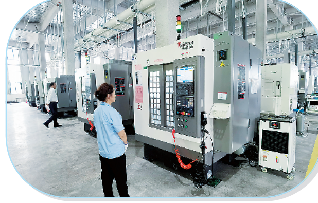
河南宇星鸿智能科技有限公司精密构件项目。

该项目总投资1亿元,占地面积3000平方米。新增智能化生产线及配料室、装卸车间等设施。该项目采用国内领先的柔性生产技术和工艺,根据市场需求,可随时增加奶制品、茶饮、纯净水等多种高端饮品类型,产品覆盖河南全域,辐射中部六省。目前,该项目已建成投产。