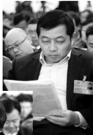
2月25日,周口市四届人大三次会议在周口人民会堂开幕,市人大代表认真听会。