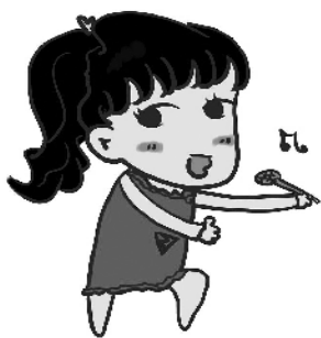
小记者:宗雪琪 编号:186328 融辉黄冈学校三(2)班

我的名字叫宗雪琪,今年 8 岁。和同龄人相比,我算高个儿,瓜子脸,眼睛虽然不大,但炯炯有神,留着黑黑的长发,扎着高高的马尾辫。