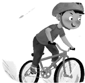
小记者:石倚菲 编号:186153 商水县直二小三(1)班