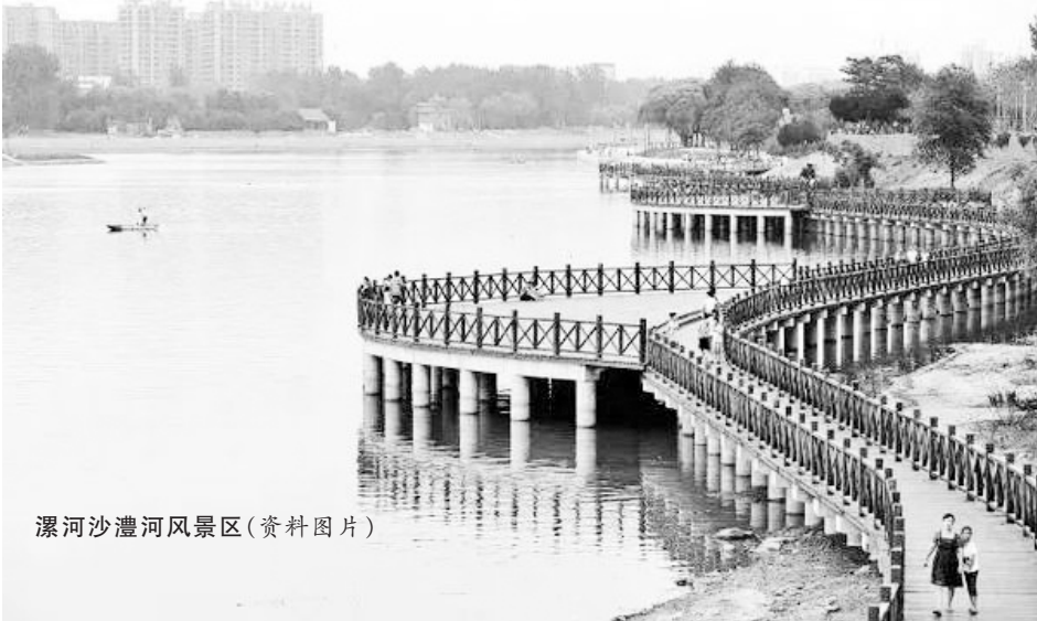
漯河沙澧河风景区(资料图片)