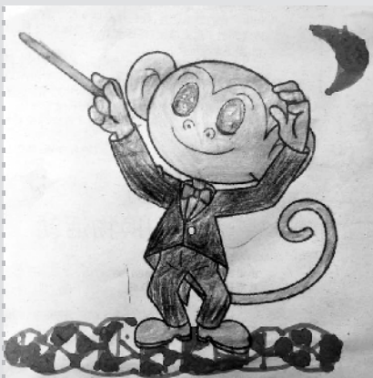
小记者:王嘉骏 编号:185334 西华县昆山学校二(2)班