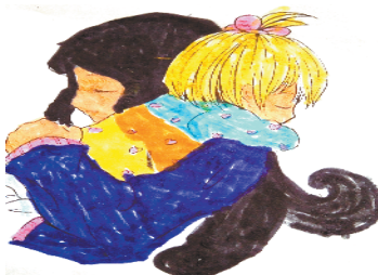
小记者:李牧青 编号:180762 周口六一路小学一(4)班