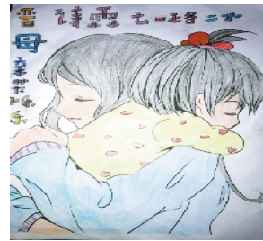
小记者:晋诗霖 编号:180349 周口七一路二小二(3)班