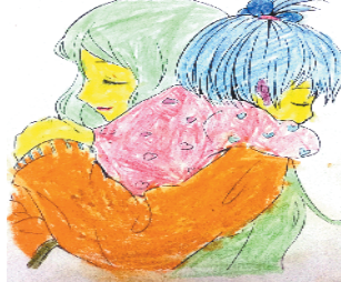
小记者:谢潇莹 编号:181591 周口七一路一小二(3)班