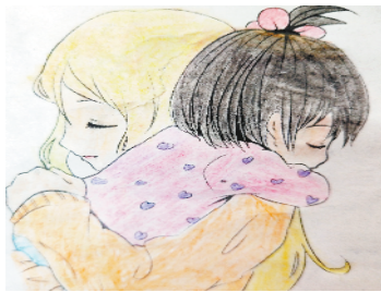
小记者:董子翔 编号:180535 周口五一路小学一(2)班