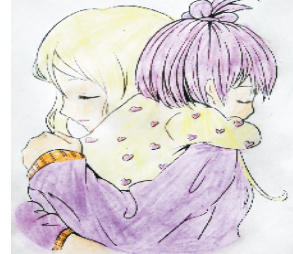
小记者:怀雨涵 编号:180639 周口五一路小学五(4)班