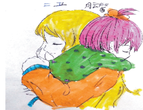
小记者:肖云馨 编号:186137 商水县第二小学二(5)班