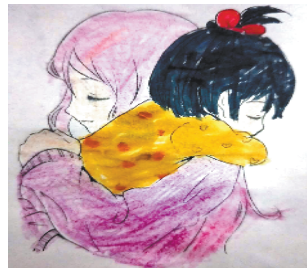
小记者:雷梓轩 编号:181783 周口作坊小学四(1)班