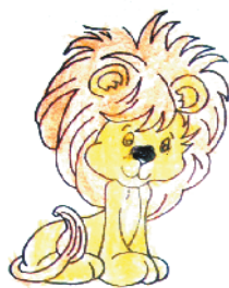
小记者:吴溪溪 编号:181153 周口文昌小学四(3)班