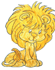
小记者:王烁 编号:188008 周口七一路二小五(4)班