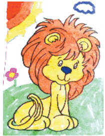
小记者:李曜 编号:185157 西华县人和路小学二(2)班