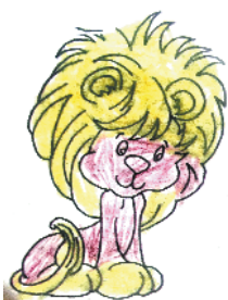
小记者:谢潇莹 编号:181591 周口七一路一小二(3)班

小记者,你是否常常想画一幅漂亮的画,可是却苦于无从下笔?现在,小记者填色游戏火热来袭,小伙伴们快来填涂属于自己的“秘密花园”吧。作品涂好后,可用相机或者手机将其拍下来发至 zkwbxjz@126.com,写清姓名、编号、学校班级,请注意图片格式和清晰度,本报将选取较好的作品在下期《小记者》和小记者微信平台集中展示。