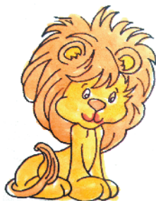
小记者:马道涵 编号:180050 周口七一路二小一(4)班