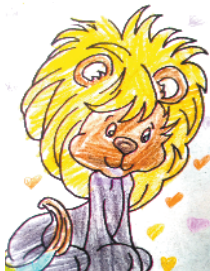
小记者:肖云馨 编号:186137 商水县第二小学二(5)班