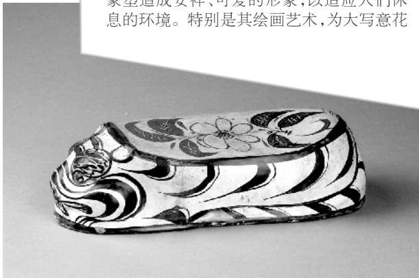
磁州窑白釉褐花卧虎瓷枕

周口关帝庙民俗博物馆所藏的卧虎枕为典型的金代磁州窑系的代表器物,具有断代意义,能较好地反映金代制瓷工艺的杰出水平。