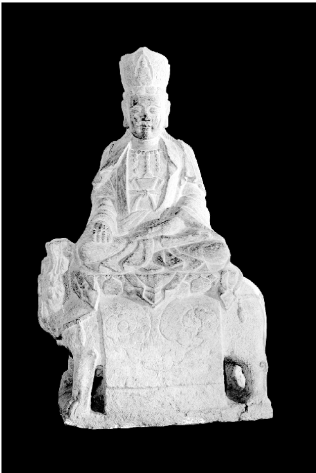
唐代汉白玉菩萨像