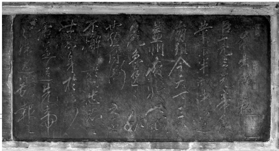
岳飞书前《出师表》石刻