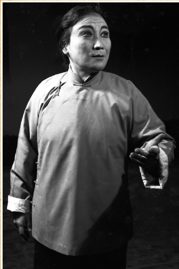
申凤梅在《扒瓜园》中饰演宋大妈