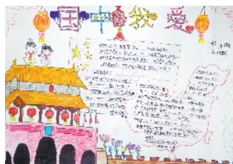
小记者:张开娴 编号:188009 周口七一路一小六(5)班