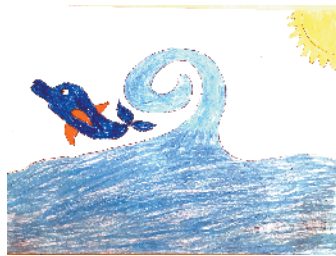
小记者:郑依果 编号:181209 周口闫庄小学三(6)班

本栏目刊发小记者的书法、绘画、摄影等作品。小记者们如果有这些爱好,快快拿起手中的笔开始创作吧!作品创作完成后,请用相机拍下来发送到 zkwbxjz@126.com