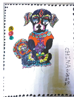
小记者:赵奕雯 编号:180032 周口闫庄小学三(3)班