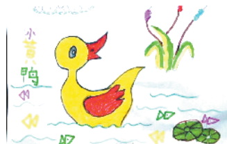
小记者:黄奕亦 编号:181807 周口闫庄小学三(1)班