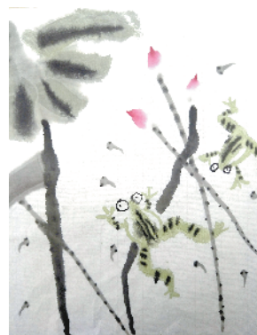
小记者:梁淇萱 编号:181809 周口闫庄小学三(5)班