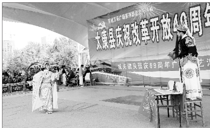
太康道情戏演出现场