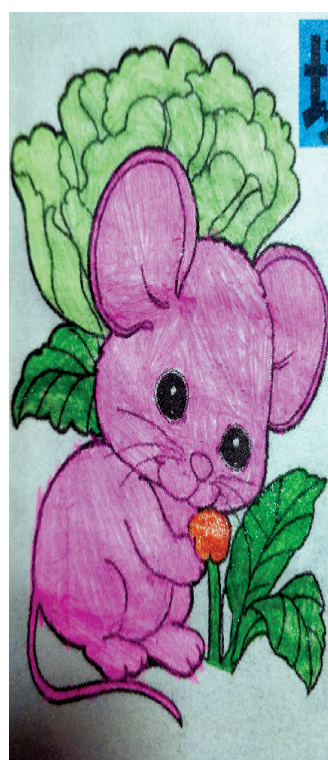
小记者：周妙盈 编号：186263 融辉黄冈小学二(1)班