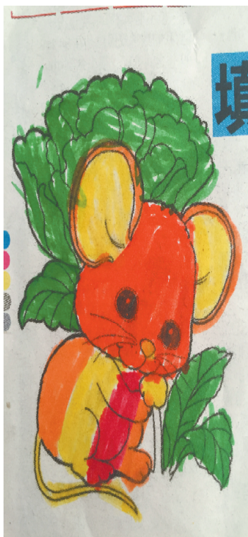
小记者：谢潇莹 编号：181591 周口七一路一小三(3)班