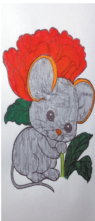
小记者：王烁 编号：188008 周口七一路二小六(4)班