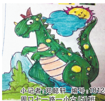
小记者:郑懿轩 编号:181289 周口七一路一小六(5)班