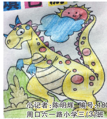
小记者:陈明辉 编号:180832 周口六一路小学三(3)班