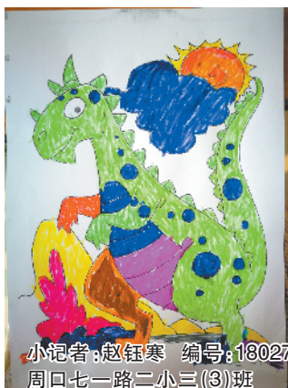
小记者:赵钰寒 编号:180275 周口七一路二小三(3)班