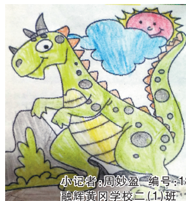
小记者:周妙盈 编号:186263 融辉黄冈学校二(1)班