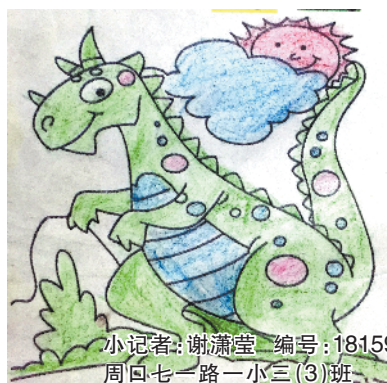
小记者:谢潇莹 编号:181591 周口七一路一小三(3)班