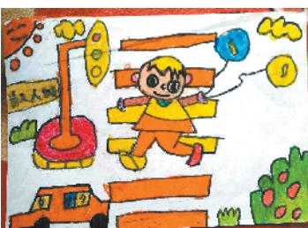
小记者:朱颢宇 编号:181333 周口七一路一小二(4)班