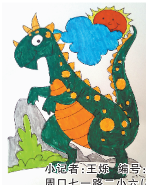
小记者:王烁 编号:188008 周口七一路二小六(4)班

小记者,你是否常常想画一幅漂亮的画,可是却苦于无从下笔?小记者填色游戏火热来袭,小伙伴们快来填涂属于自己的“秘密花园”吧。作品涂好后,可用相机或者手机将其拍下来发至zkwbxjz@126.com,写清姓名、编号、学校班级,请注意图片格式和清晰度,本报将选取较好的作品在下期《小记者》和小记者微信平台集中展示。