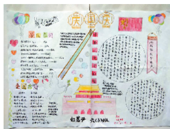
小记者:白茗尹 编号:181167 周口文昌小学六(3)班

本栏目刊发小记者的书法、绘画、摄影等作品。小记者们如果有这些爱好,快快拿起手中的笔开始创作吧!作品创作完成后,请用相机拍下来发送到zkwbxjz@126.com