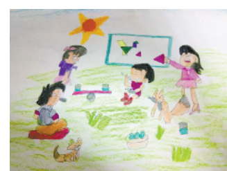
小记者:郑懿轩 编号:181289 周口七一路一小六(5)班