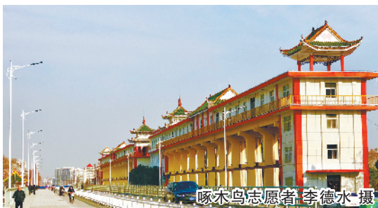
啄木鸟志愿者 李德水 摄