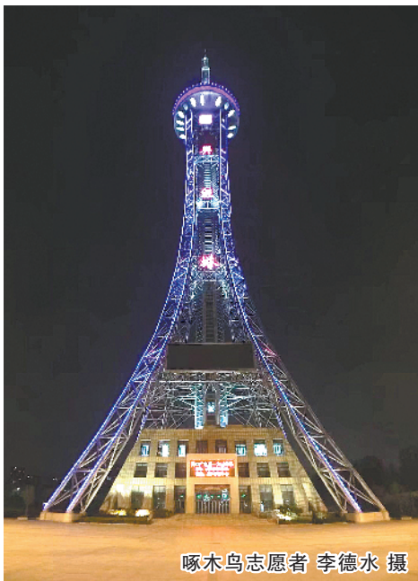
啄木鸟志愿者 李德水 摄