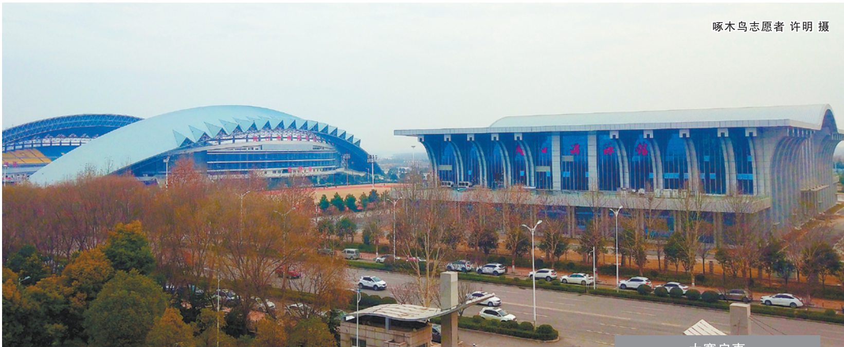
啄木鸟志愿者 许明 摄