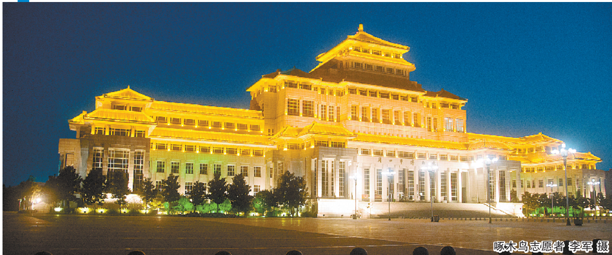
啄木鸟志愿者 李军 摄