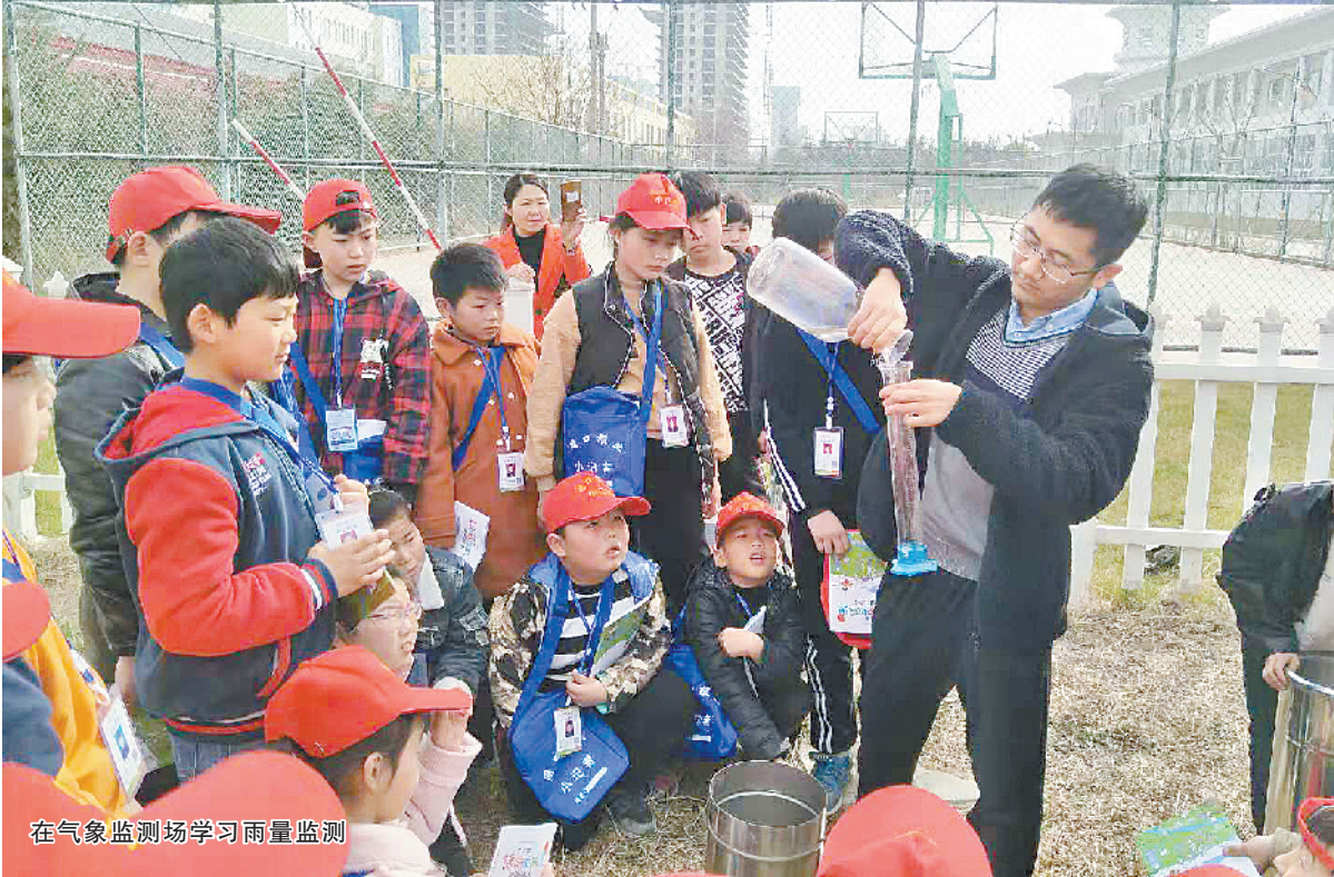
在气象监测场学习雨量监测