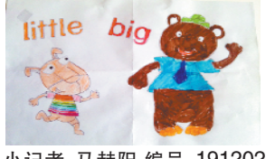
小记者:马赫阳 编号:191202 周口七一路一小四(5)班