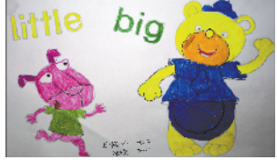
小记者:张开伦 编号:190007 周口七一路一小一(2)班