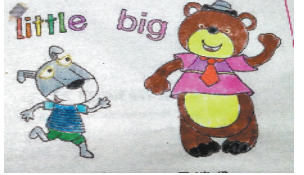
小记者:孙浩越 编号:192721 周口闫庄小学三(6)班