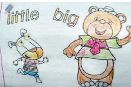
小记者:邵羿翔 编号:191396 周口建设路小学三(1)班