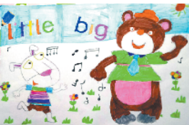
小记者:理竞玉 编号:192621 周口闫庄小学二(5)班