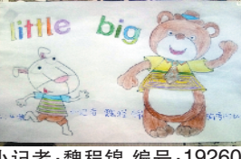
小记者:魏程锦 编号:192601 周口闫庄小学二(4)班