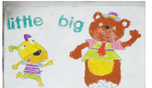
小记者:高子淇 编号:190318 周口七一路二小一(4)班