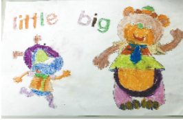
小记者:姚嘉 编号:192081 周口奔腾小学二(2)班