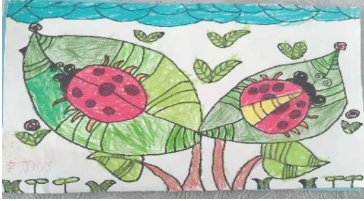
七星瓢虫 小记者:李可欣 编号:192337 周口文昌小学一(4)班