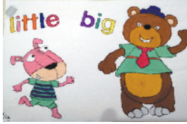
小记者:王乐 编号:192745 周口闫庄小学四(5)班