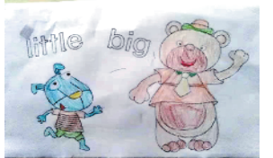
小记者:李树瑜 编号:192613 周口闫庄小学二(4)班