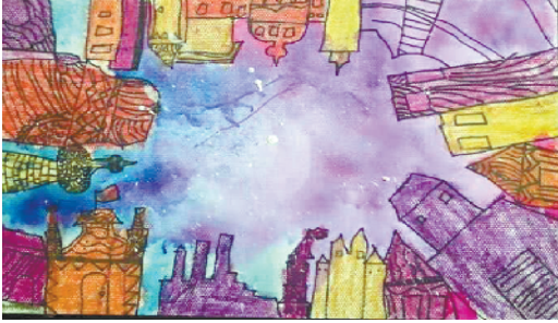
五彩星空 小记者:崔一美 编号:191886 周口李庄小学二(1)班