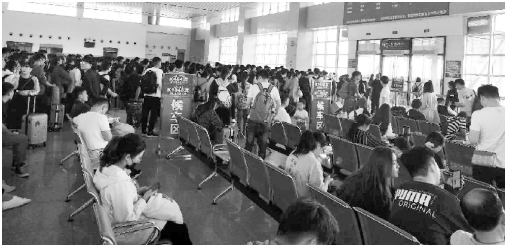
“五一”假期周口火车站出行旅客

据周口铁路客运部门相关负责人分析，今年“五一”假期客流量大幅增加的原因有两个方面，一是假期时间比去年多一天，市民出行意愿强烈；一是我市去年新增了平顶山至上海K462/4次列车和漯河至宁波K1437/8次两对列车。