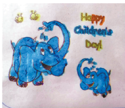
小记者：罗位一 编号：193076 周口六一路小学一(6)班