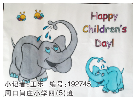
小记者：王乐 编号：192745 周口闫庄小学四(5)班