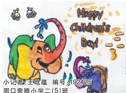
小记者：王璐蕴 编号：192125 周口奔腾小学二(5)班