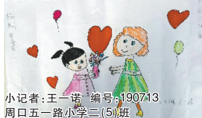
小记者：王一诺 编号：190713 周口五一路小学二(5)班