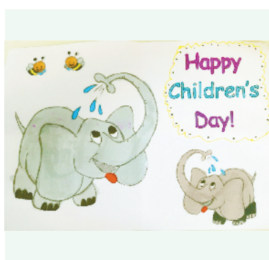
小记者：方怡帆 编号：191166 周口七一路一小三(1)班