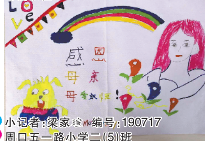
小记者：梁家璇 编号：190717 周口五一路小学二(5)班