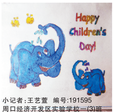
小记者：王艺萱 编号：191595 周口经济开发区实验学校二(3)班