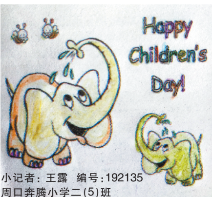
小记者：王露 编号：192135 周口奔腾小学二(5)班