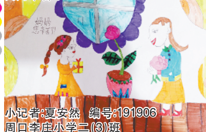
小记者：夏安然 编号：191906 周口李庄小学二(3)班