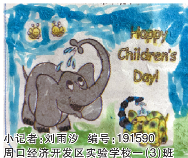
小记者：刘雨汐 编号：191590 周口经济开发区实验学校一(3)班