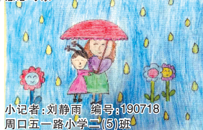
小记者：刘静雨 编号：190718 周口五一路小学二(5)班