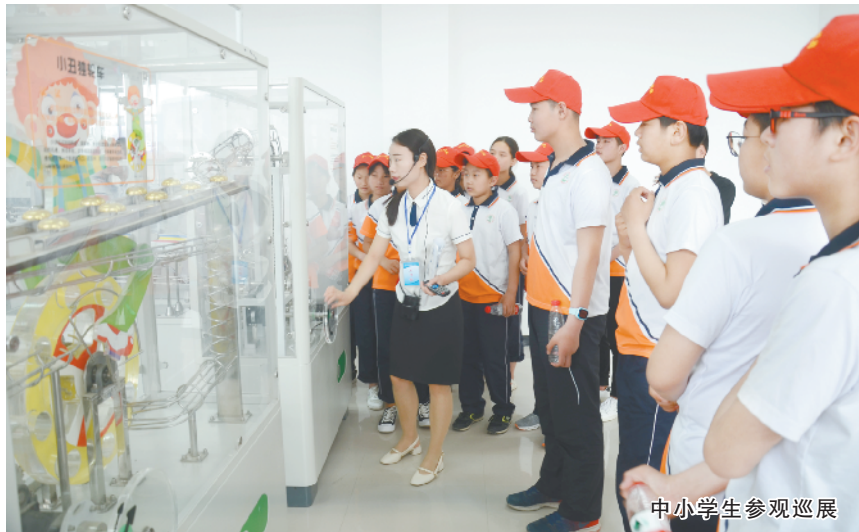
中小學生參觀巡展