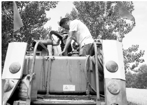
厉兵秣马备战“三夏”

5月29日,商水县黄寨镇一合作社人员在检修收割机具。为确保“三夏”生产顺利开展,该镇组织人员积极检修收割机具,备战“三夏”。