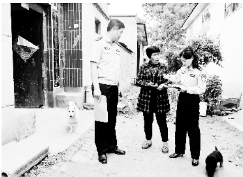
防溺水宣传进村入户

连日来,商水县公安局组织民警深入社区、村庄,以实际行动掀起“践行新使命、忠诚保大庆”活动热潮。图为5月28日,该局民警在胡吉镇后张村走访宣传“防溺水、防诈骗、防火灾”常识。