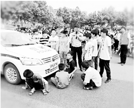
交通安全常识进校园

连日来,商水县公安局组织民警深入社区、村庄,以实际行动掀起“践行新使命、忠诚保大庆”活动热潮。图为5月28日,该局民警在胡吉镇后张村走访宣传“防溺水、防诈骗、防火灾”常识。