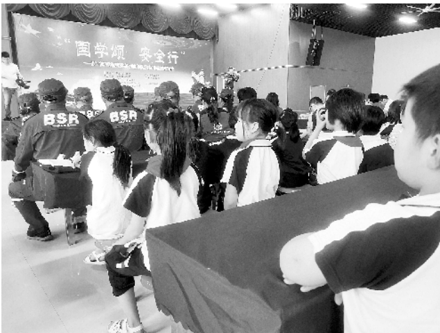
关爱保护留守和困境儿童

5月29日,由市民政局、商水县人民政府主办的“国学颂 安全行”——周口市开展关爱保护留守和困境儿童系列示范活动在商水县中英文学校举行。周口市国学文化促进会向该校捐赠200本图书,樊登小读者分会捐赠100张启蒙卡,市民政局有关负责人为该校颁发“周口市关爱保护儿童示范基地”牌匾。