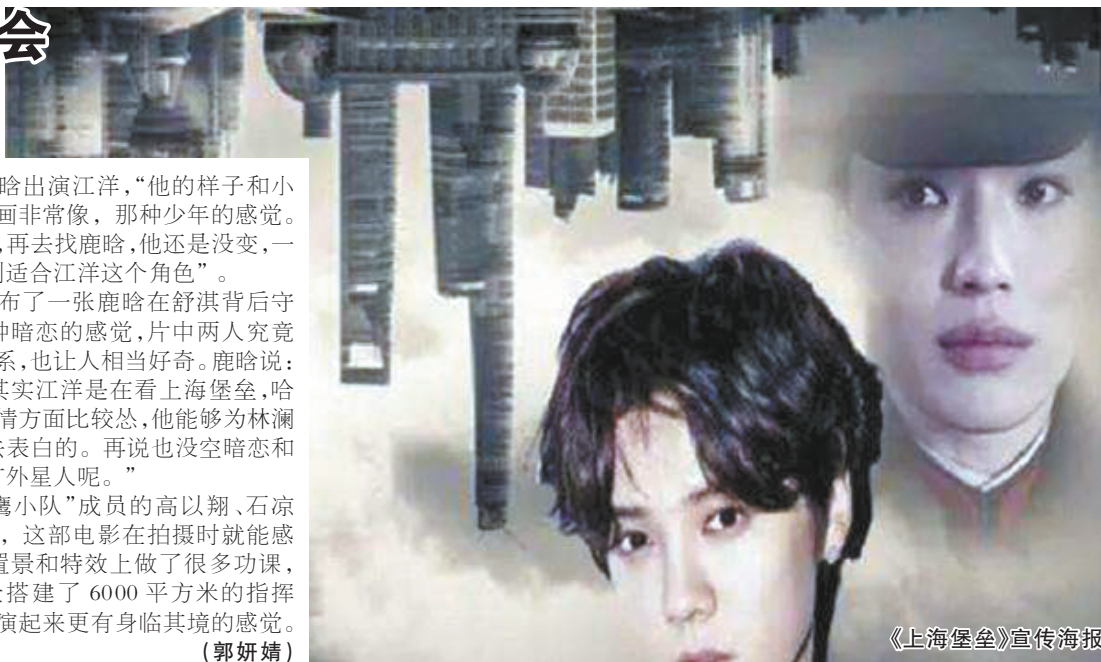
《上海堡垒》宣传海报