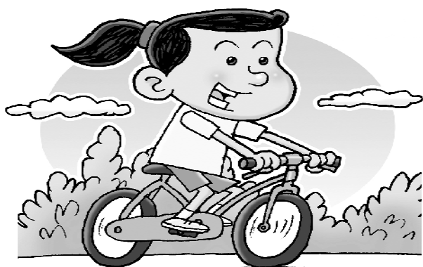
适当运动 舒缓情绪