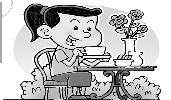
尽早收心 调整状态