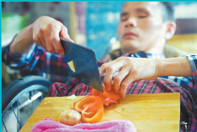
在胸前的砧板上切菜