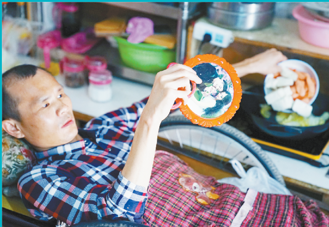
看着镜子往锅里倒菜