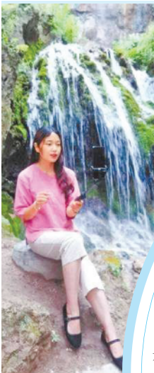
景区工作人员在抖音直播