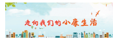
走向我们的小康生活