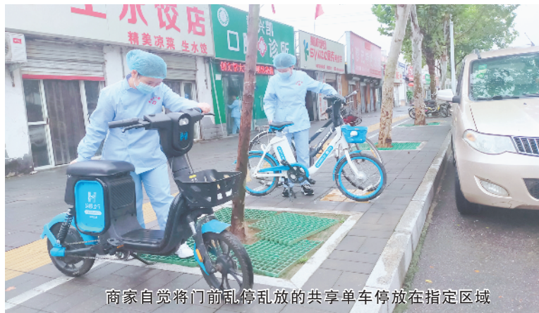
商家自觉将门前乱停乱放的共享单车停放在指定区域