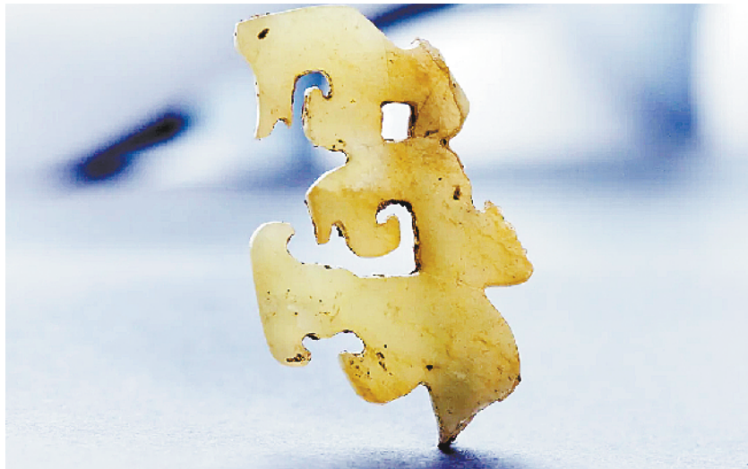
平粮台古城遗址出土的玉冠饰残片