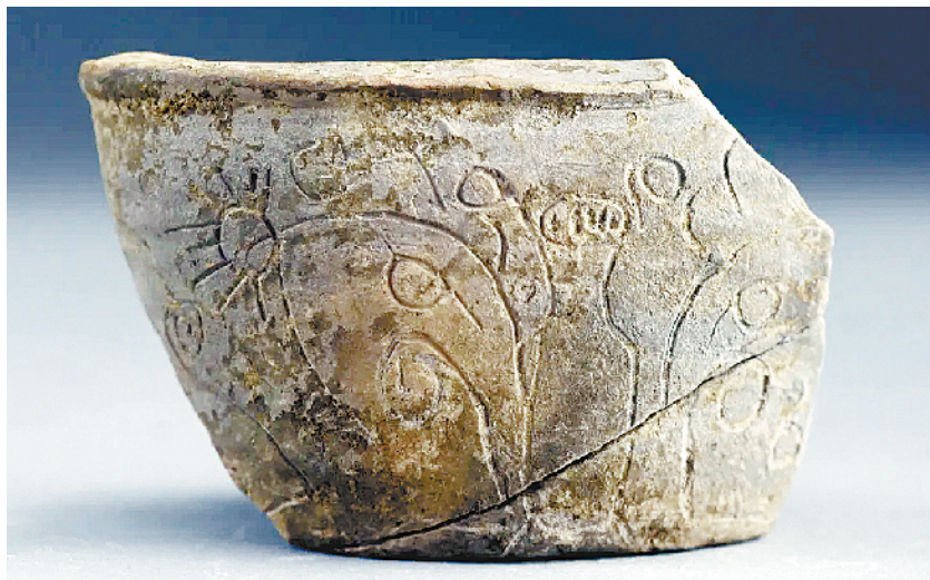
平粮台古城遗址出土的陶碗

这个名字与当时明清时期运河的兴盛与周家口码头的繁荣有一定关系。平粮台的东边约 300 米是古蔡河,蔡河的故道随着周家口码头的兴盛,江淮流域的粮食沿着这条河道向北运输。为了粮食防潮,在中转的过程中要找到一个高台地存放,平粮台距离这个运河地又是一个天然的高地,当时经常有粮食在这儿中转通过陆路或者其他方式运往各地,所以这个地方就叫做平粮台了。