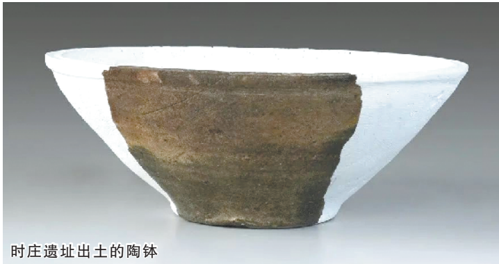
时庄遗址出土的陶钵