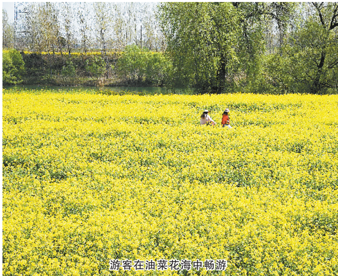
游客在油菜花海中畅游

座谈会结束后，许昌日报社相关负责人表示：“同为省内地市报，周口日报社为我们提供了报社改革转型升级的新思路，真是很有收获，不虚此行！”