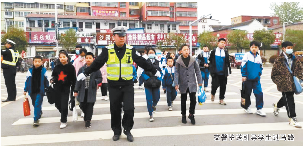
交警护送引导学生过马路