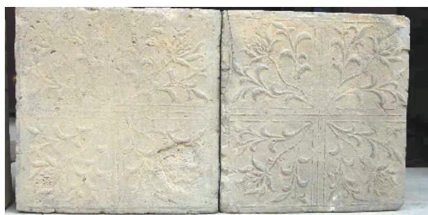
太清宫遗址出土的金代牡丹纹铺地砖