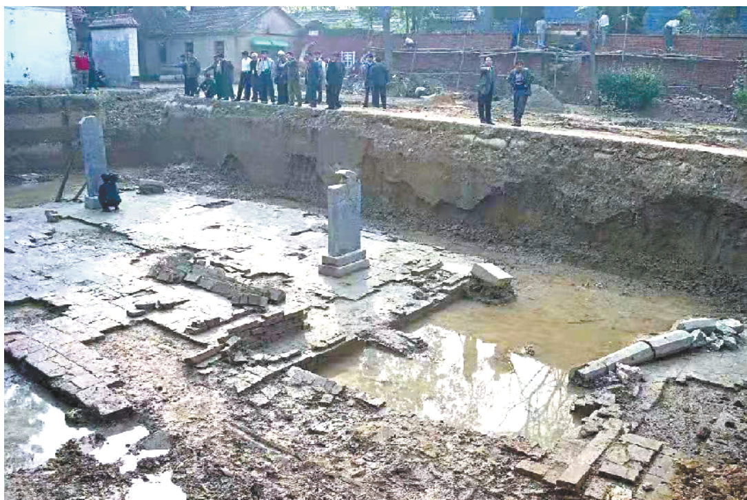
太清宫遗址发掘现场

悠悠涡河,蜿蜒东去,孕育了豫东平原城市——鹿邑。提起鹿邑,避不开圣哲老子。老子所著的《道德经》在西方的发行量仅次于《圣经》,是中国哲学的瑰宝。两千多年来,老子的道家思想不仅深深影响着中国、滋养着中华文化,而且越来越显示出其对纷繁复杂的当今世界的启迪、警醒和前瞻意义。皇宫看故宫,道宫看太清。本期“考古周口”就让我们走近老子故里,欣赏太清宫两千余年波澜壮阔的历史画卷。