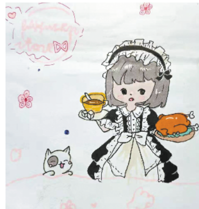
小记者:温子柔 证号:211069 周口闫庄小学二(5)班

本栏目刊发小记者的书法、绘画、摄影等作品。小记者们如果有这些爱好,快快行动起来吧!作品完成后,请用相机拍下并发送到 zkwbxjz@126.com。