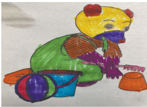
小记者:孙文悦 证号:210520 周口李庄小学一(4)班