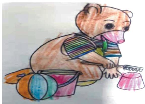
小记者:张文硕 证号:210518 周口李庄小学一(4)班