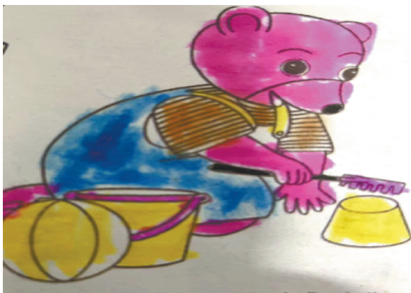
小记者:杨易萱 证号:210508 周口李庄小学一(4)班