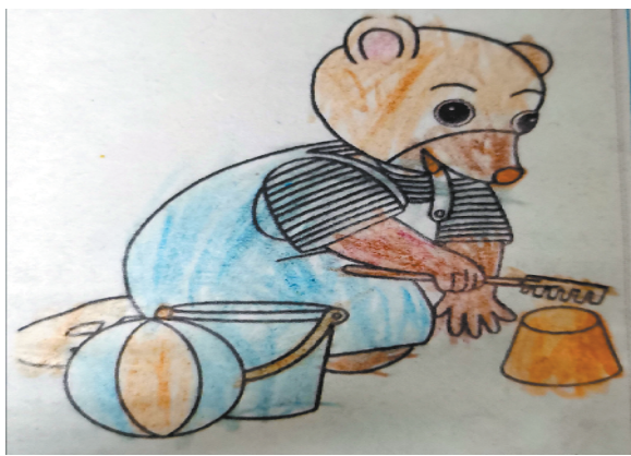
小记者:刘可欣 证号:210510 周口李庄小学一(4)班