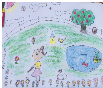
小记者:谢依靠 证号:211119 周口实验小学一(1)班