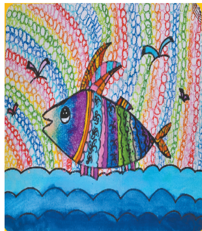
小记者:焦璐然 证号:210886 周口示范区盛和小学三(5)班