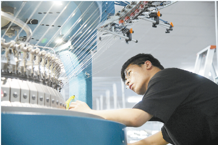
8月26日，技术人员检修机器。商水县坚持疫情防控与经济社会发展“两手抓”，绷紧疫情防控这根弦，主导产业纺织服装企业在严格落实核酸检测、体温测量、厂区消杀、分散就餐、用具消毒等疫情防控措施基础上，全部复工复产，员工加班加点生产，力争把耽误的时间赶回来。

排查整治危害水工程安全运行问题。排查各类水工程安全运行情况，整治侵占和破坏河道堤防、水库大坝、灌排渠道、水文监测等水利工程及其附属设施。整治在水利工程管理范围内和安全保护区内危害工程安全运行的行为。 依法严厉打击各类涉水违法犯罪活动。行政部门对涉嫌刑事犯罪的，要及时移交公安机关，符合受理条件的，公安机关要予以受理，在行政部门协作配合下开展全面调查取证工作，构成犯罪的，绝不姑息迁就，做到除恶务尽。③5