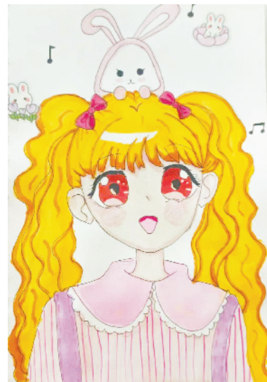
小记者:温子柔 证号:211069 周口闫庄小学二(5)班