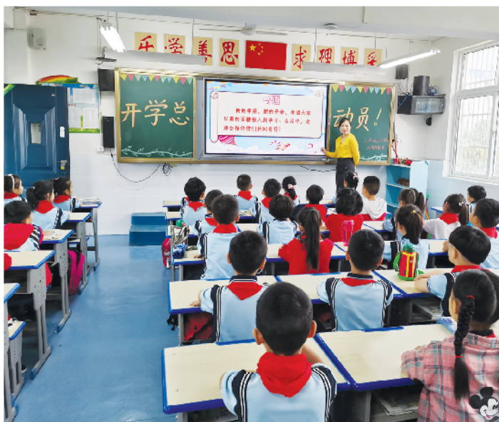
开学第一课“请党放心,强国有我”