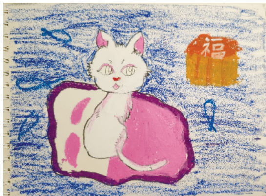
小记者:杨诗韵 证号:201705 周口经开区实验学校二(1)班