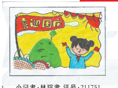
小记者:林琮聿 证号:211751 周口莲花路小学二(1)班