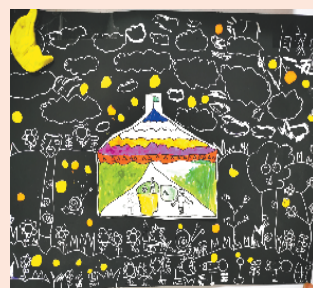
小记者:闫家睿 证号:210529 周口李庄小学二(5)班

本栏目刊发小记者的书法、绘画、摄影等作品。小记者如果有这些爱好,快快行动起来吧!作品完成后,请用相机拍下来并发送到 zkwbxjz@126.com。