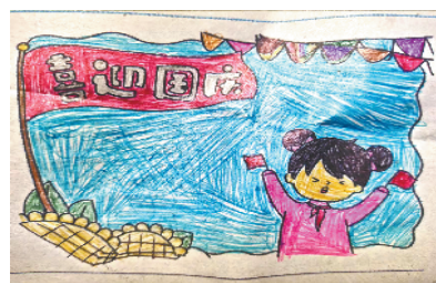
小记者:刘默存 证号:210505 周口李庄小学二(4)班