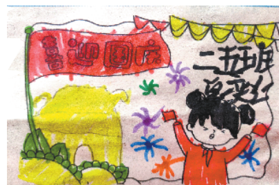
小记者:单奕仁 证号:210523 周口李庄小学二(5)班