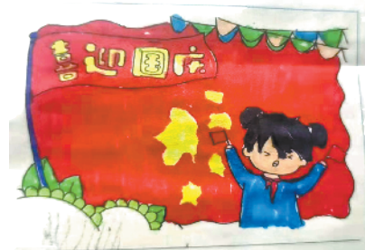
小记者:陆楚霖 证号:210543 周口李庄小学二(5)班