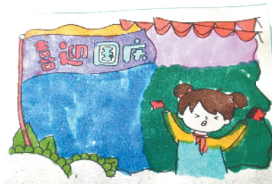
小记者:齐颖哲 证号:210500 周口李庄小学二(3)班