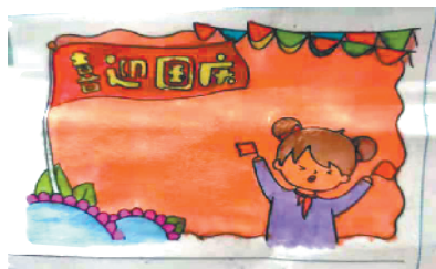
小记者:魏栖玥 证号:210475 周口李庄小学二(2)班