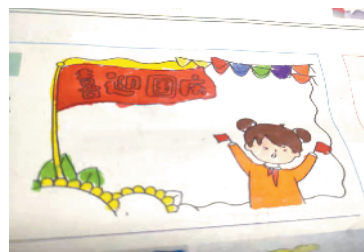
小记者:田浩辛 证号:210578 周口李庄小学二(7)班