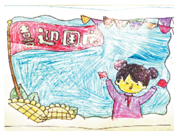
小记者:王子凡 证号:210498 周口李庄小学二(3)班