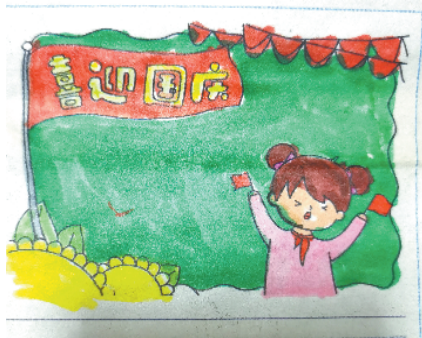
小记者:夏一涵 证号:210275 周口五一路小学三(3)班